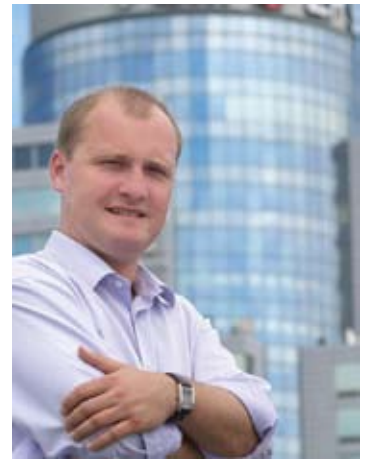
Piotr Krzystek - Prezydent Miasta Szczecin Piotr Krzystek - Prezydent Miasta Szczecin